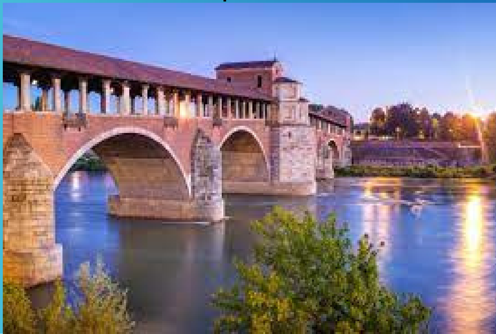
Il Ponte coperto di Pavia

Middle Management, Futuro, Responsabilità, Valorizzazione